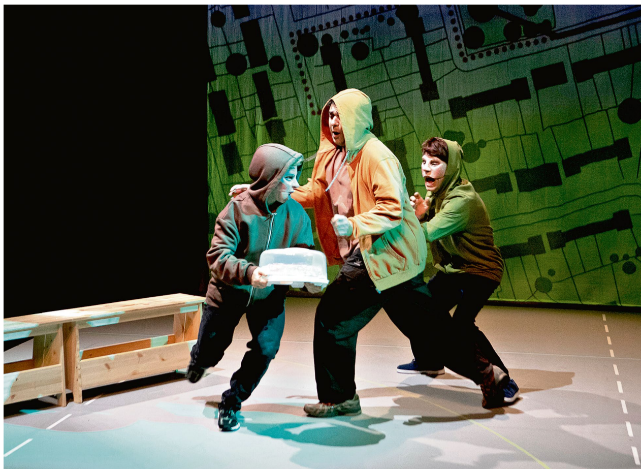
Dans «La Couleur des choses», Simon est harcelé par des voyous de quartier. Au fond, un plan tiré de la bande dessinée. (NICOLAS BRODARD)